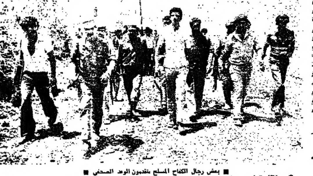
بعض رجال الكفاح المسلح يتفحصون الوعد الصحي